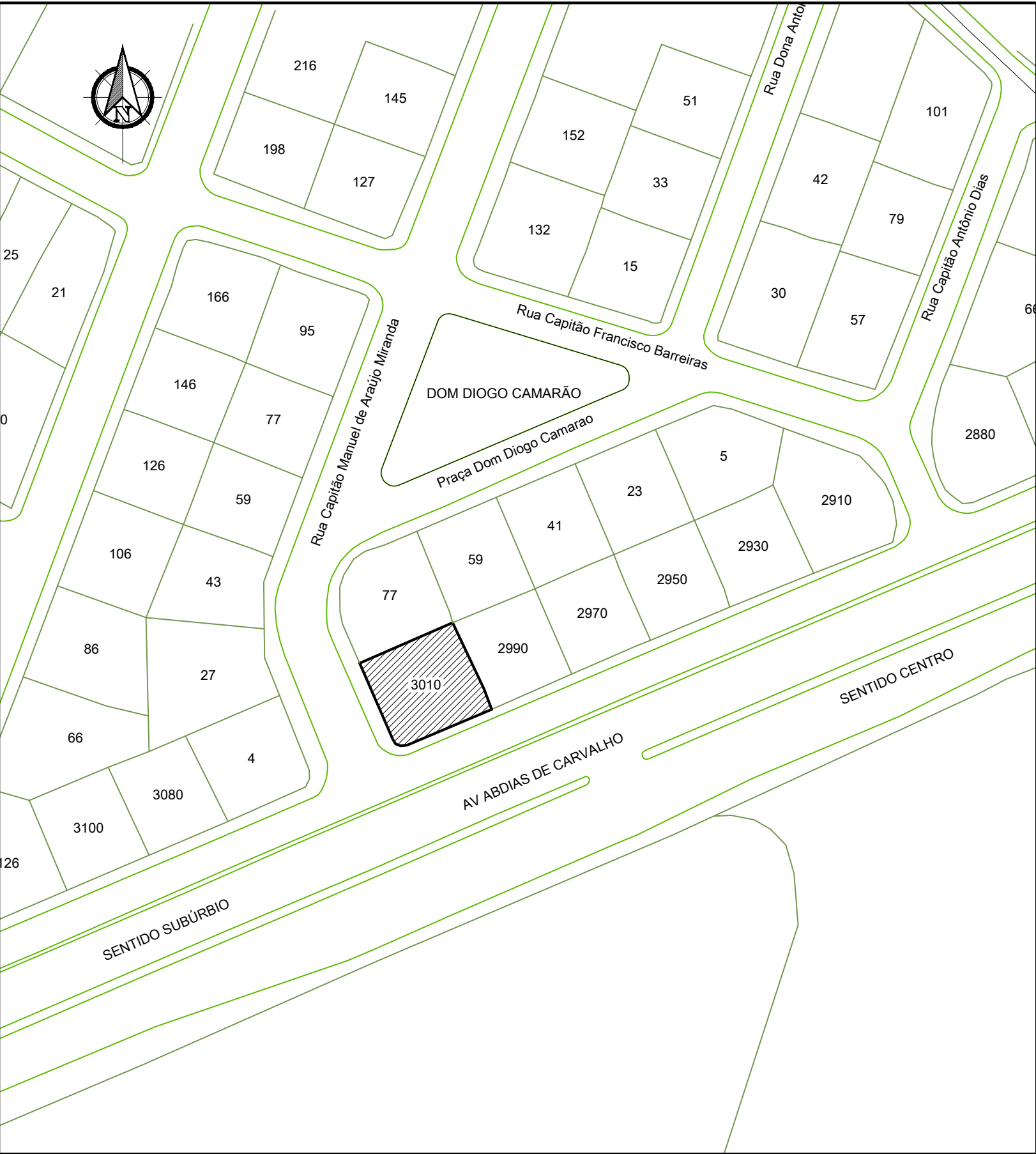
SITUAÇÃO ESC: __1:1000